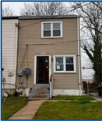
Antes de la Rehabilitación

El Departamento de Vivienda y Desarrollo Comunitario del condado de Prince George en convenio con Housing Initiative Partnership y la Autoridad de Desarrollo del condado de Prince George le ofrecen préstamos de hasta $60,000 para hacer mejoras a su vivienda, a dueños de casa que sean elegibles y que necesiten hacer reparos a sus viviendas.